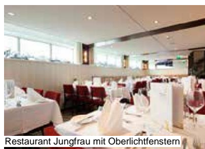
Restaurant Jungfrau mit Oberlichtfenstern