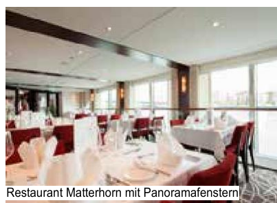
Restaurant Matterhorn mit Panoramafenstern