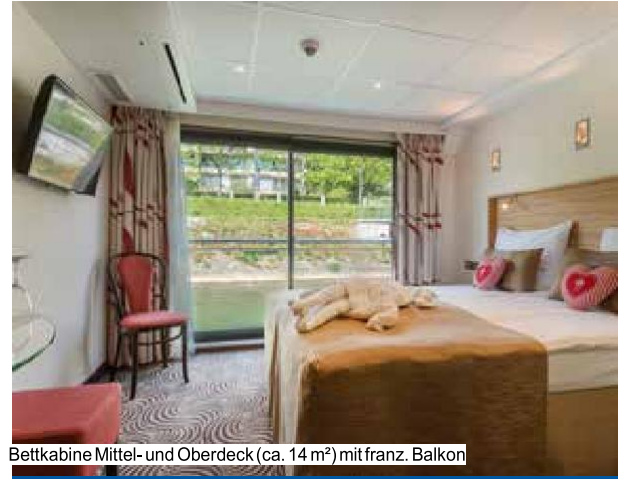
Bettkabine Mittel- und Oberdeck (ca. 14 m 2 ) mit franz. Balkon